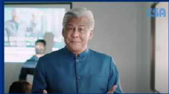
Video Korporat CSA Academy