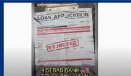
4 Sebab Bank Reject Permohonan Pinjaman

https://www.youtube.com/watch?v=40X2uAQ73ug