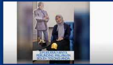
3 Perkara Hanya Perunding Pinjaman Boleh Tolong Anda

https://www.youtube.com/watch?v=rqUZnW9ouCY