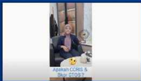
Apakah CCRIS & Skor CTOS?

https://www.youtube.com/watch?v=hE6YZY2mjOU