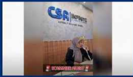
6 Tanda Scammer Kewangan

https://www.youtube.com/watch?v=rqUZnW9ouCY